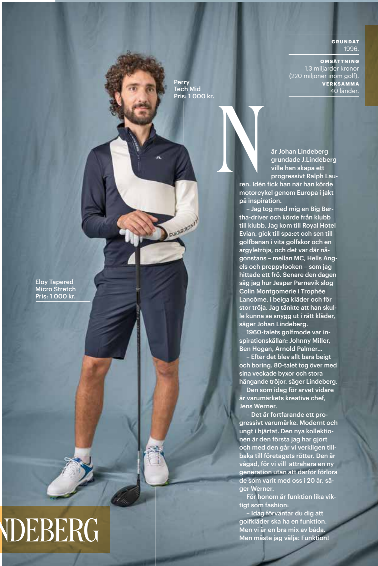
Eloy Tapered Micro Stretch Pris: 1 000 kr.