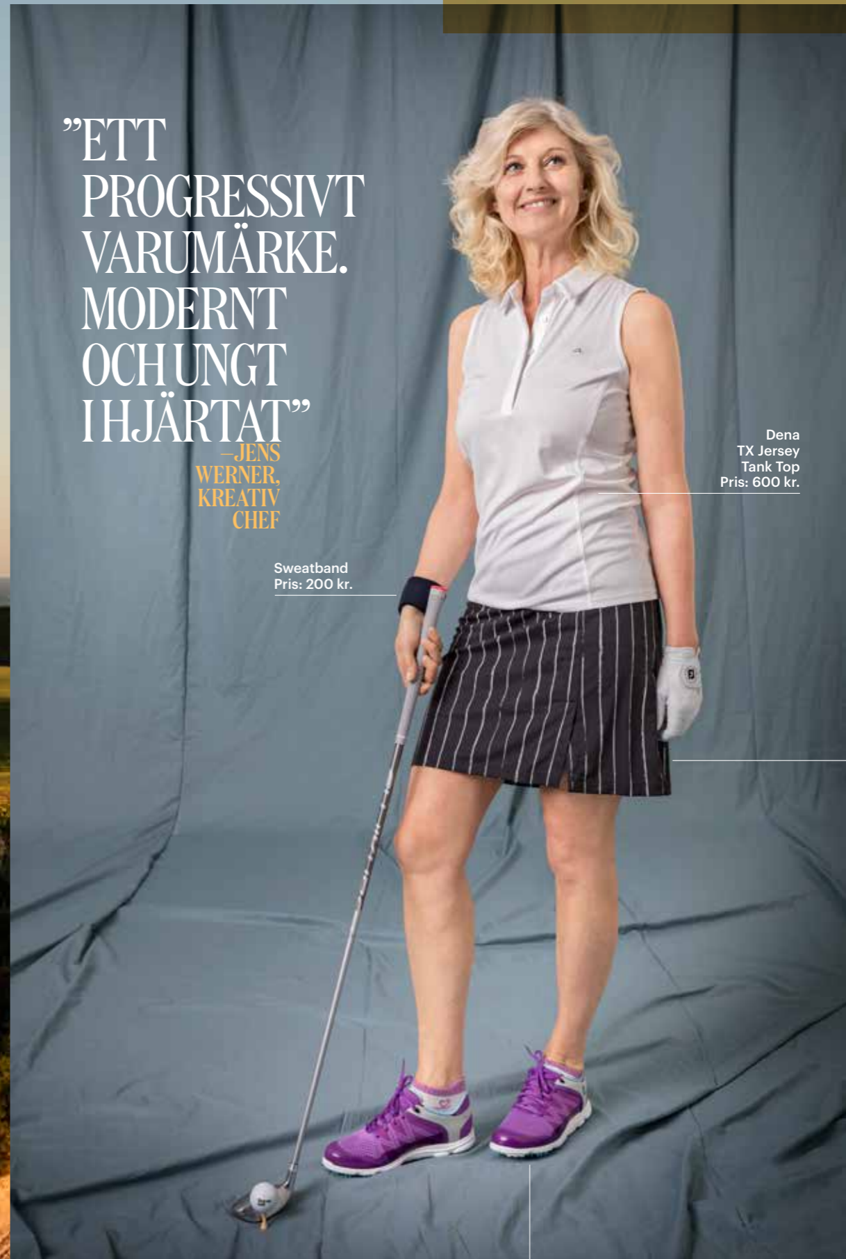
Footjoy Tour-S Pris: 2 800 kr.

”ETT PROGRESSIVT VARUMÄRKE. MODERNT OCH UNGT I HJÄRTAT”